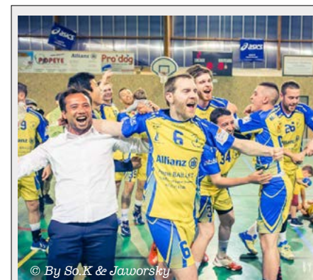
21 mai 2016

Spectacle Klee Dans le cadre du mois des tout-petits