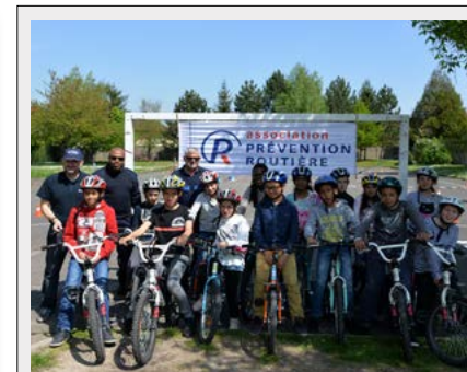
03 mai 2016

Inauguration «Troies habitat» 70 nouveaux logements saviniens