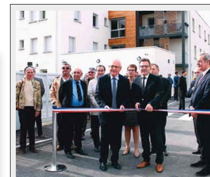
22 avril 2016