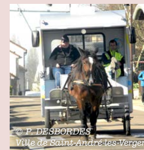
Collecte hippomobile pour le tri sélectif

à bien trier leurs déchets. Afin de ne pas perturber la circulation (transports en commun notamment), la collecte hippomobile ne concernera pas les grands axes de la ville ni les habitats collectifs dont les déchets recyclables sont déposés dans des conteneurs.