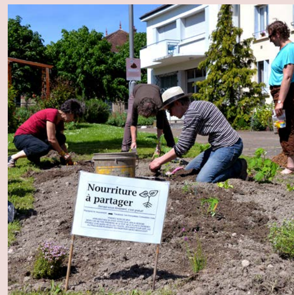
Les incroyables comestibles une autre façon de vivre avec l'espace urbain

Nous vous l'annonçons dans le Savinien de printemps, les Incroyables comestibles ont débarqué à Sainte-Savine !