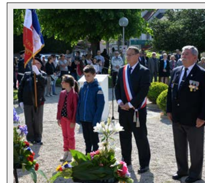
8 mai 2016

Séjour ANCV destinés aux Seniors du CCAS