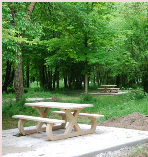
Nouveaux aménagements au parc de la Noue Lutel

Depuis le début du mois, les visiteurs du parc de la Noue Lutel peuvent profiter de nouveaux aménagements.