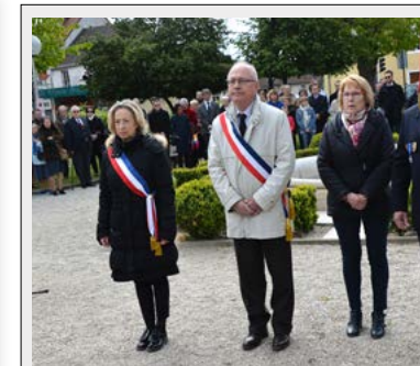
24 avril 2016

Club de basket SSB maintien en Nationale 1