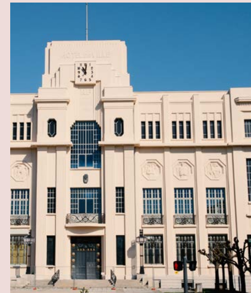
« L'Art Déco » nouveau centre culturel de Sainte-Savine

Le suspens aura duré plusieurs mois, de nombreux Saviniens l'attendaient, les journalistes ont souvent tenté de soutirer l'information... Mais rien n'a filtré !