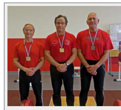
29 avril 2016

Cérémonie commémorative journée du souvenir de la Déportation