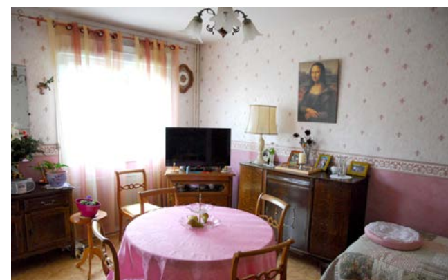
Les Orchidées - Foyer logement rue Eugène Laroche

dans des teintes colorées et chaleureuses propices à la bonne humeur. Saluons l'implication des peintres, menuisiers, maçons et électriciens de la Ville qui ont effectué un travail de grande qualité. Sur ces cinq appartements, trois ont d'ailleurs déjà été reloués.