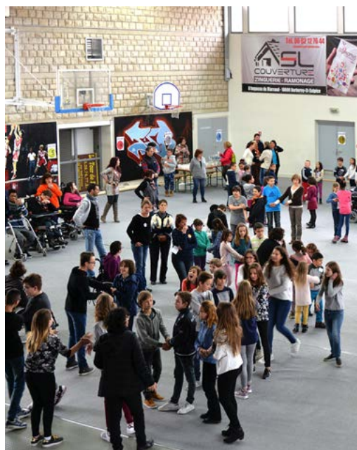
Journée de l'avenir et de la citoyenneté Mardi 26 avril 2016

Le 26 avril, près de 200 écoliers, venus des écoles Jules Ferry, Lucie Aubrac, du collège Paul Langevin et de l'Institut Chanteloup, se sont retrouvés lors de la première édition de la Journée de l'Avenir et de la Citoyenneté.