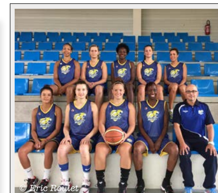
22 mai 2016

Club de basket SSB maintien en Nationale 1