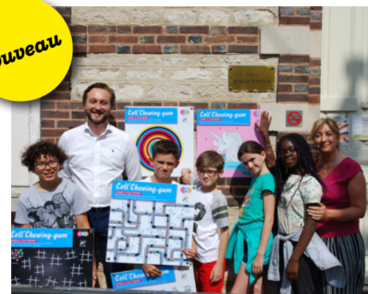
Sous forme de jeux, les panneaux invitent les enfants à coller les chewing-gums dessus

Les chewing-gums jetés par terre un peu partout en ville représentent un vrai problème de civilité et de propreté urbaine. Difficiles à décoller, ils sont un vrai casse-tête pour les agents de la ville chargés du nettoyage des trottoirs. Les CMJ de Sainte-Savine se sont donc emparés du problème !