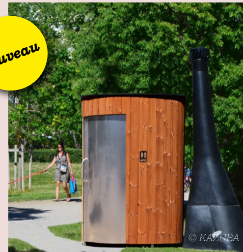
Des toilettes sèches seront installées prochainement au parc de la Noue Lutel

Le Parc de la Noue Lutel dispose depuis quelques semaines d'un nouvel équipement, installé dans le cadre du plan pluriannuel d'aménagement du site par la ville, en collaboration avec le Conseil des habitants. Un parcours santé pour enfants a donc vu le jour, offrant aux familles une raison supplémentaire de venir passer un moment dans cet écrin de verdure à quelques pas de la ville.