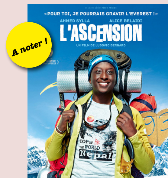
27 juillet : projection de «L'ascension» de Ludovic BERNARD

Vendredi 27 juillet, le centre social sera en fête et proposera, de la fin de l'après-midi jusqu'à minuit, des activités à partager de 7 à 77 ans !