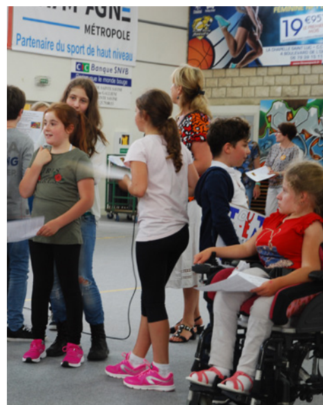
La journée de l'avenir le temps fort de cette 1ère édition de la «semaine de la jeunesse»

Le début du mois a été marqué par le lancement de la première édition de la Semaine de la jeunesse.