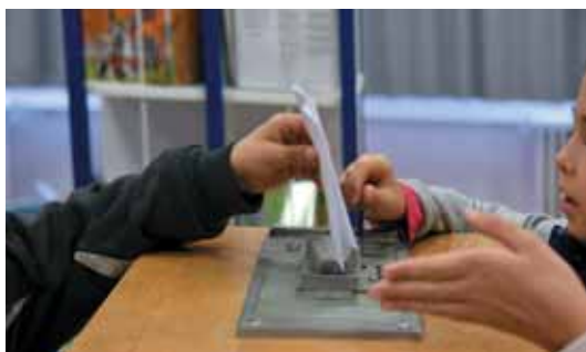
Elections des CMJ

Dès la fin du mois de septembre, la campagne battra son plein dans les écoles saviniennes et au collège avant les élections qui auront lieu dans chaque établissement le 17 octobre. Vous pourrez découvrir le visage du nouveau Conseil Municipal Jeunes à partir du 5 novembre, date à laquelle il sera installé pour une année. Très peu de temps après les élections, les enfants participeront à diverses actions qui marqueront la fin de l'année : cérémonie du 11 novembre, Téléthon, collecte de Noël au bénéfice de l'épicerie sociale, après-midi décoration